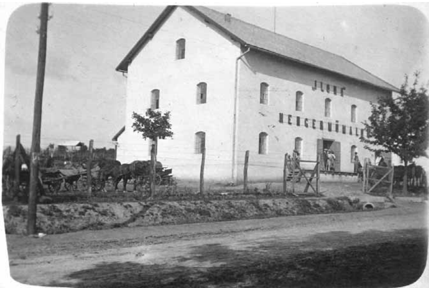
A malom 1913-ban