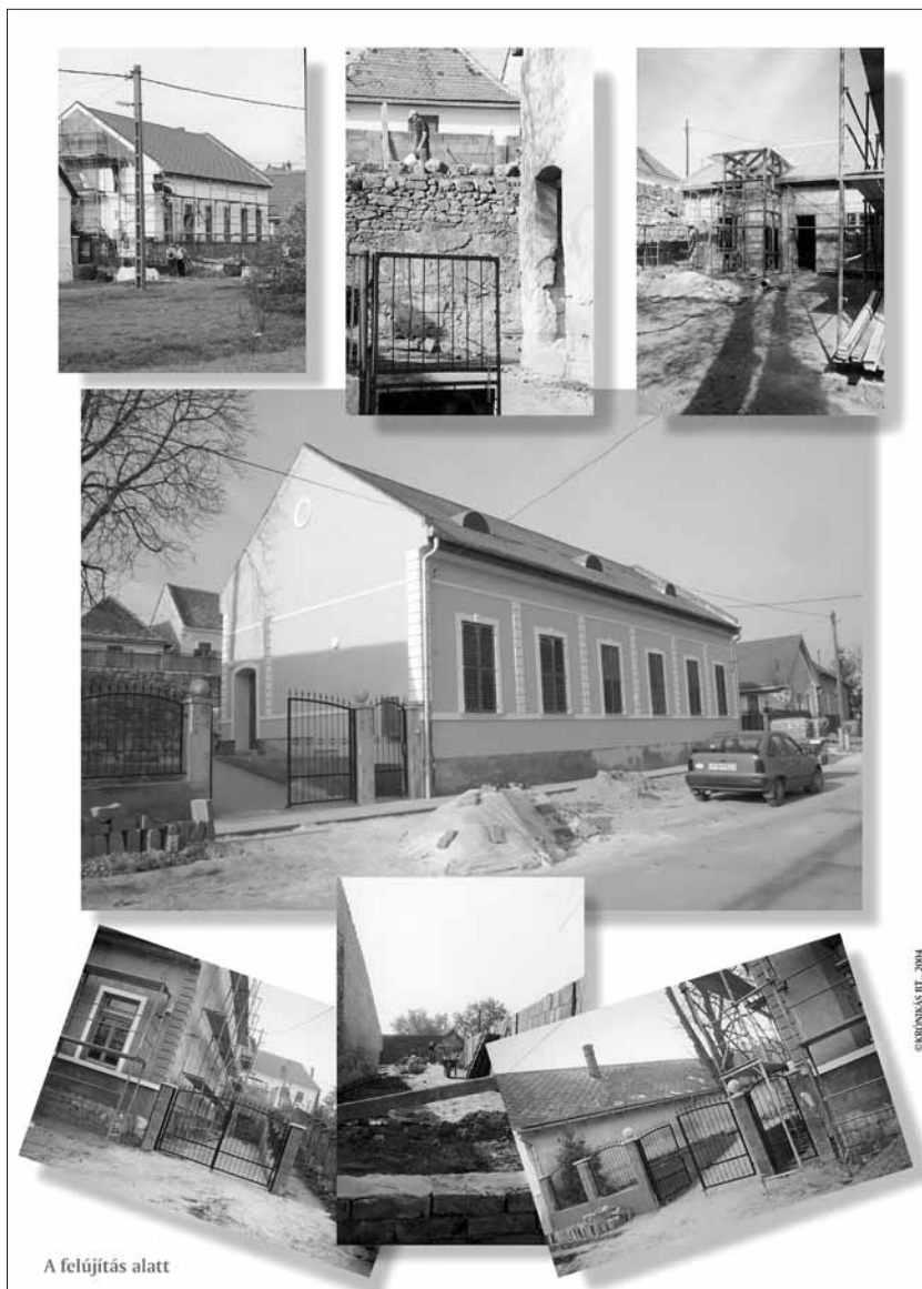
Tablóképek a kiállítás anyagából

A lakosság jelképesen a március 15-ei ünnepséggel – ehhez kapcsolódva az épület történetét bemutató kiállítással, és a Kor-